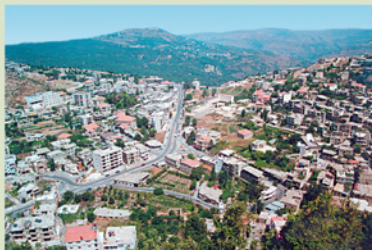
Vue du village

Jezzine se caractérise aussi par ses églises centenaires qui se distinguent par