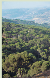
Pinède de Bkassine