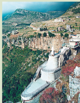
Sayerdet Al Maabour